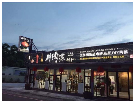
位於大湖的耕陶源藝術中心