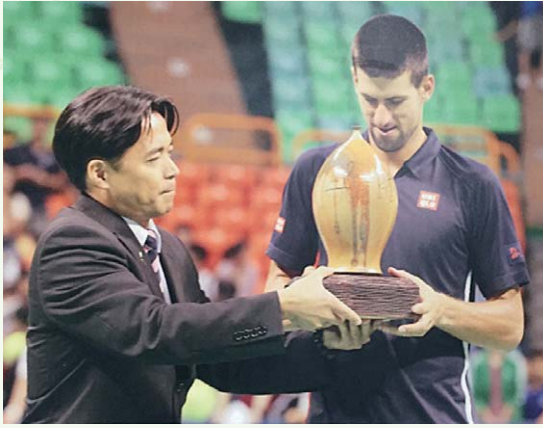
仁耀校友致贈世界球王喬科維奇小口瓶

一件藝術作品，除了是藝術家圓熟技巧與個人獨到美學的極致展現外，更是創作者生命淬鍊後的內蘊精隨。仁耀校友在小口瓶技藝上的創新突破以及持續精進研發的精神，於2011年獲選為十大傑出青年，自然是實至名歸。目前他的小口瓶作品，已蒙美國伊利諾大學、中國北京大學、宋慶齡基金會等單位收藏。2012年「台灣世界網球爭霸賽」冠軍得主—世界球王喬科維奇，即對仁耀校友致贈的小口瓶讚賞有加。