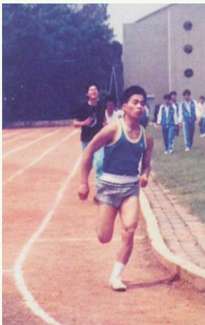
高中三年級1500公尺冠軍 刷新大會紀錄