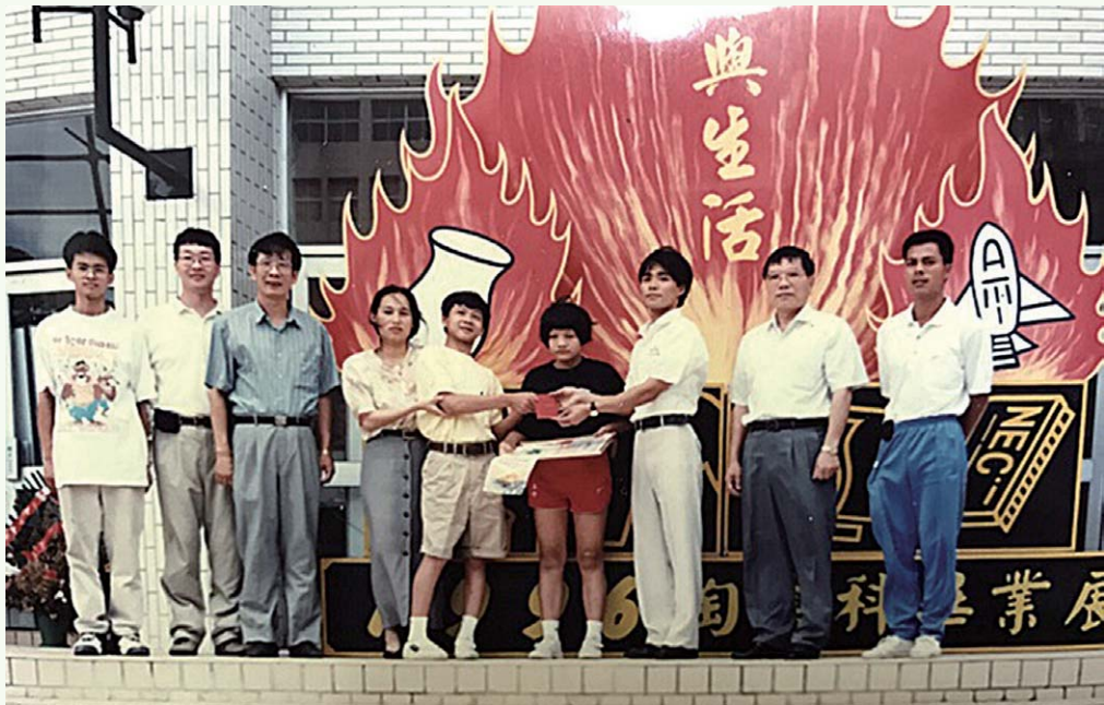
慈善義賣所得捐助幼安教養院