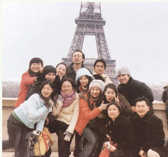
遠赴巴黎參加藝術交流